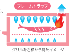
グリルを右横から見たイメージ

万一、グリル内の魚などに引火した場合は、排気口から炎が出ることを抑制し、火災を未然に防止。パロマは全てのグリル付コンロに搭載しました。