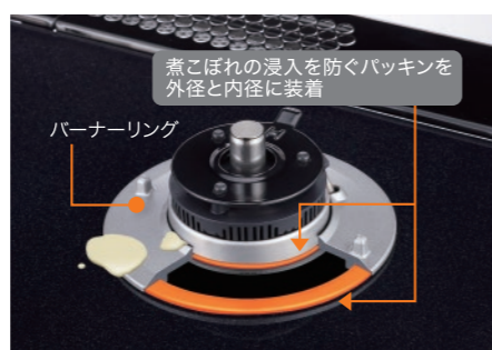
イラストはイメージです