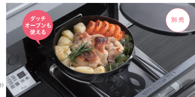
シンプルグリルダッチオープン使用例

※試験方法:「焼き網」[シンプルグリルダッチオープン]にて切り身の鯖2切れを調理。グリル庫内のお手入れ部品(焼き網・シンプルグリルダッチオープンを除く)への飛び散り量を5回測定し平均値を算出。焼き網(強火:7分)シンプルグリルダッチオープン(強火:7分)にて調理。